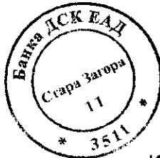
ИВЕЛИНА ИВАНОВА МЕНИДЖЪР ВРЪЗКИ С КОРПОРАТИВНИ КЛИЕНТИ

БИЗНЕС ЗОНА СТАРА ЗАГОРА УЛ.МЕТРОПОЛИТ МЕТОДИЙ КУСЕВ 8 6000 СТАРА ЗАГОРА Call Center: 0700 10 375