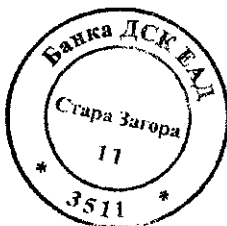
ТАТЯНА ПЕЕВА МЕНИДЖЪР КОРПОРАТИВНО БАНКИРАНЕ