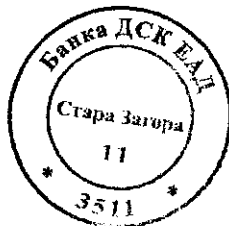
ИВЕЛИНА ИВАНОВА МЕНИДЖЪР ВРЪЗКИ С КОРПОРАТИВНИ КЛИЕНТИ

БИЗНЕС ЗОНА СТАРА ЗАГОРА УЛ.МЕТРОПОЛИТ МЕТОДИЙ КУСЕВ 8 6000 СТАРА ЗАГОРА Call Center: 0700 10 375