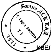
ИВЕЛИНА ИВАНОВА МЕНИДЖЪР ВРЪЗКИ С КОРПОРАТИВНИ КЛИЕНТИ

БИЗНЕС ЗОНА СТАРА ЗАГОРА УЛ.МЕТРОПОЛИТ МЕТОДИЙ КУСЕВ 8 6000 СТАРА ЗАГОРА Call Center: 0700 10 375